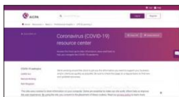
AICPA Coronavirus (COVID-19) Resource Center

კოვიდ-19-თან დაკავშირებულ რესურსებზე წვდომა ქვემოთ მოცემულ გამოსახულებებზე მასის დაწკაპუნებით