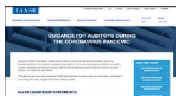
IAASB Guidance for Auditors During the Coronavirus Pandemic