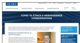
IESBA COVID-19: Ethics & Independence Consideration